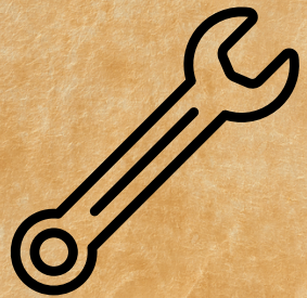
La Clé de Mimiolette