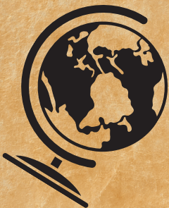
Le Globe Magique