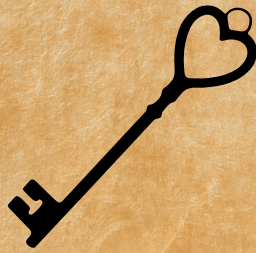
La Clé de l'atelier