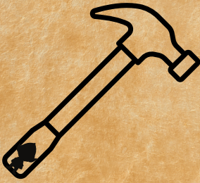
Le Marteau magique