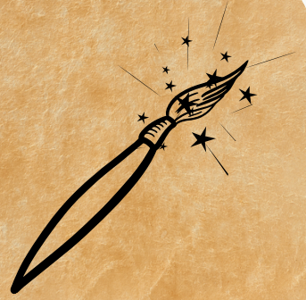
Le pinceau enneigé