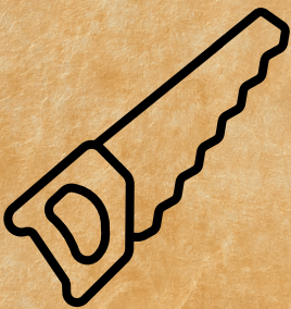
La Scie du lutin