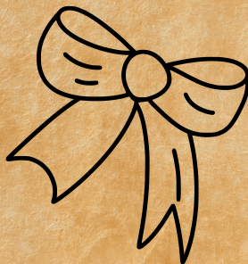
La Boite à Rubans